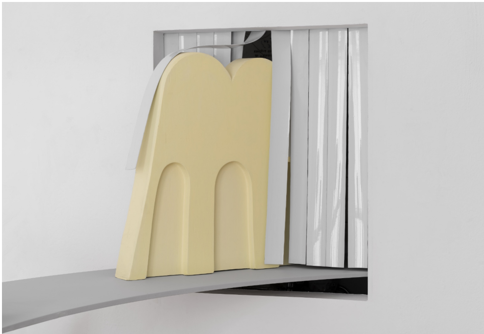
Detail „Mise en Place“, Galerie Feiertag, 2025 Ohne Titel, 2024, Öl, Pigment, Nägel, Leim, Holz