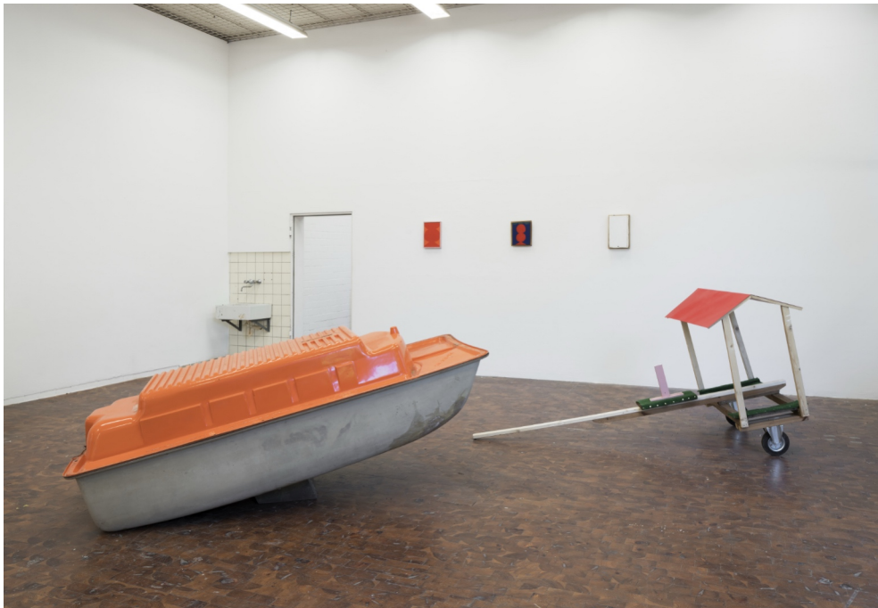
Installationsansicht Rundgang Kunsthochschule Kassel, 2022