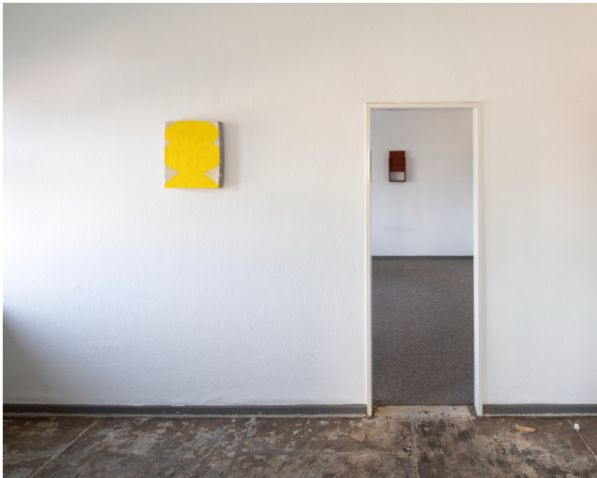
Installationsansicht „Büro Reuter“, 2023