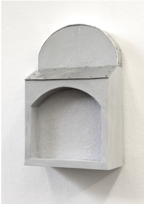
Ohne Titel, 2023, 44 x 27 x 13cm, Aluminium, Graphit, Öl, Leim, Holz, Nägel