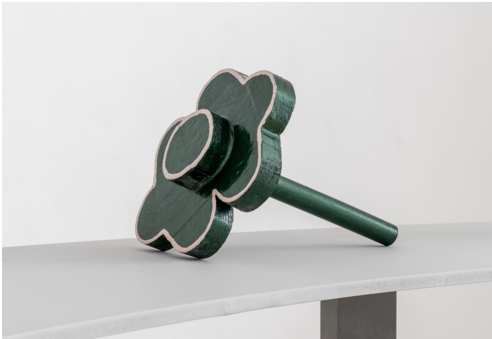
Ohne Titel (Das Blümchen), 2025, 21 x 16,5 x 25cm, Lack, Öl, Nägel, Klammern, Holz Nicolas Wefers