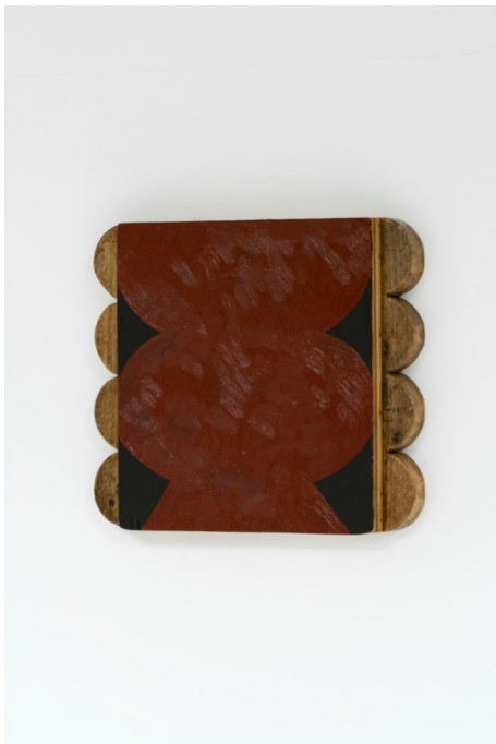
Ohne Titel, 2023, 34 x 39 x 5.3cm, Öl, Acryl, Schellack, Nägel, Holz