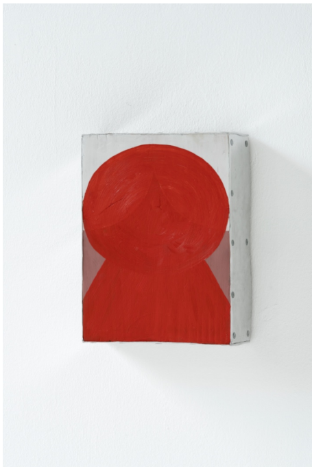
Ohne Titel, 2023, 26 x 20 x 7,5cm, Aluminium, Öl, Holz, Nägel