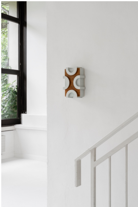
Installationsansicht „Neue Bankverbindung“, 2023