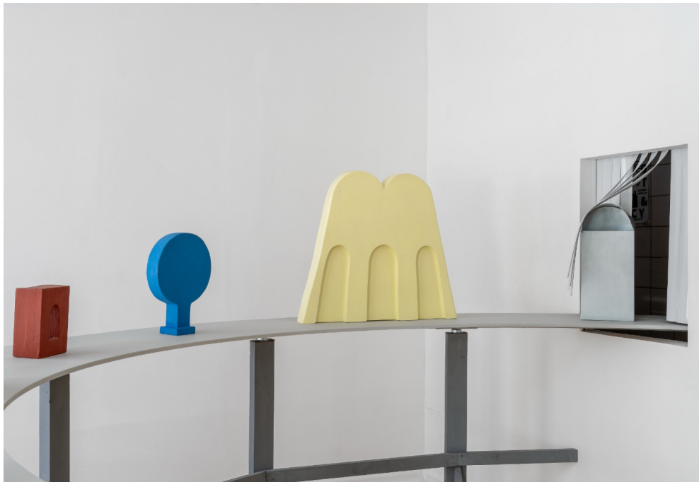
Installationsansicht „Mise en Place“, Galerie Feiertag, 2025 Elektromotor, Mdf, Holz, Filz, Kugellager, PVC, Gummi, Aluminium, Lack, Öl, Pigment, Graphit, Kalkfarbe, Schrauben und Nägel (verfügbar)