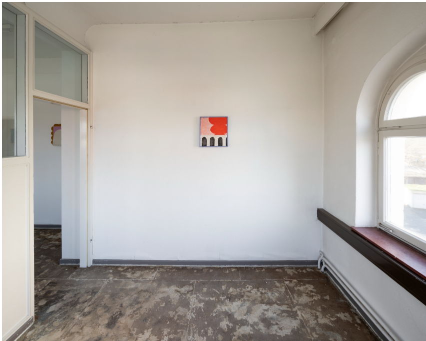
Installationsansicht „Büro Reuter“, 2023, Objekt: Ohne Titel, 2023, 38 x 35,5 x 5cm, Öl, Acryl, Holz, Nägel