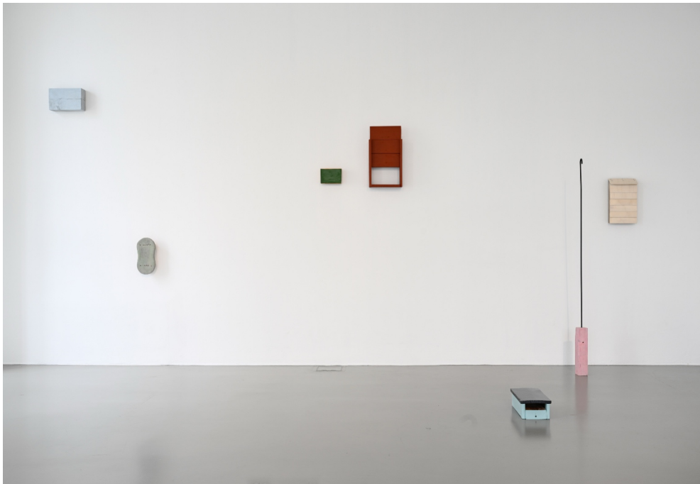
Installationsansicht Kasseler Kunstpreis der Wolfgang Zippel-Stiftung, Kasseler Kunstverein, 2024