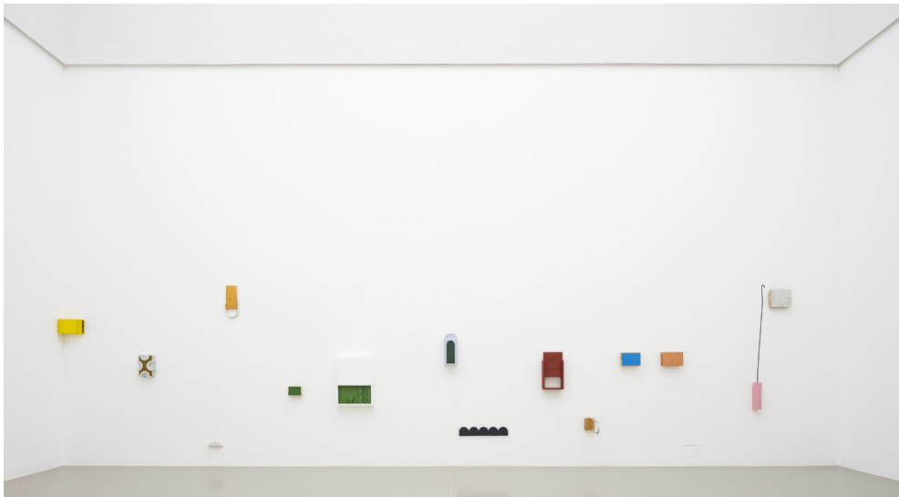
Installationsansicht EXAMEN, documenta-Halle Kassel, 2023