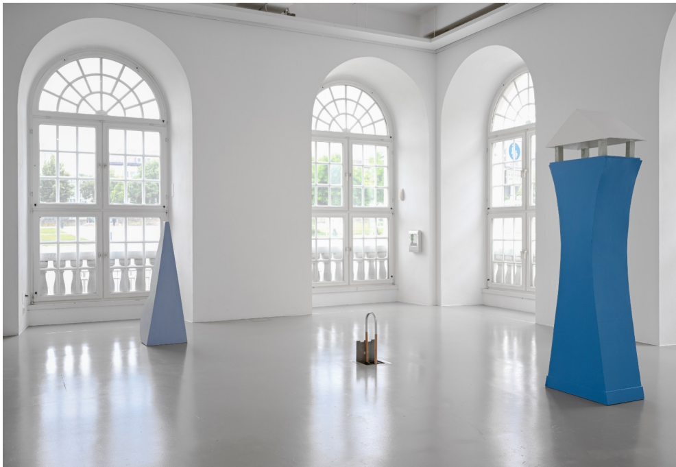
Installationsansicht Kasseler Kunstpreis der Wolfgang Zippel-Stiftung, Kasseler Kunstverein, 2024