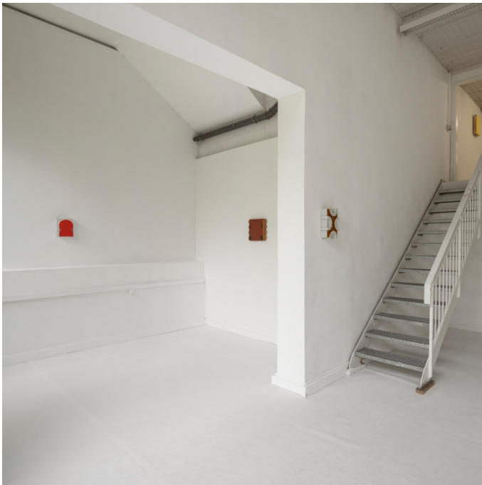
Installationsansicht „Neue Bankverbindung“, 2023