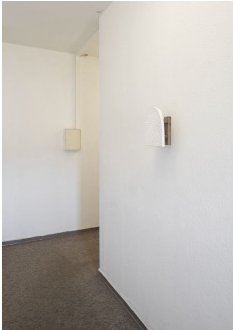
Installationsansicht „Büro Reuter“, 2023, Objekt: Ohne Titel, 2023, 26,5 x 23,5 x 14,3cm, Dispersionsfarbe, Putz, Nägel, Holz