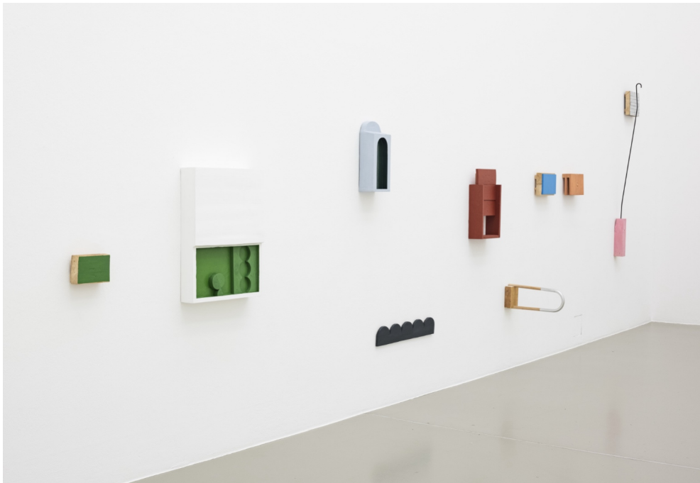
Installationsansicht EXAMEN, documenta-Halle Kassel, 2023