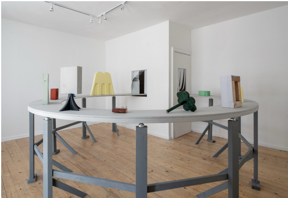
Installationsansicht „Mise en Place“, Galerie Feiertag, 2025 Elektromotor, Mdf, Holz, Filz, Kugellager, PVC, Gummi, Aluminium, Lack, Öl, Pigment, Graphit, Kalkfarbe, Schrauben und Nägel