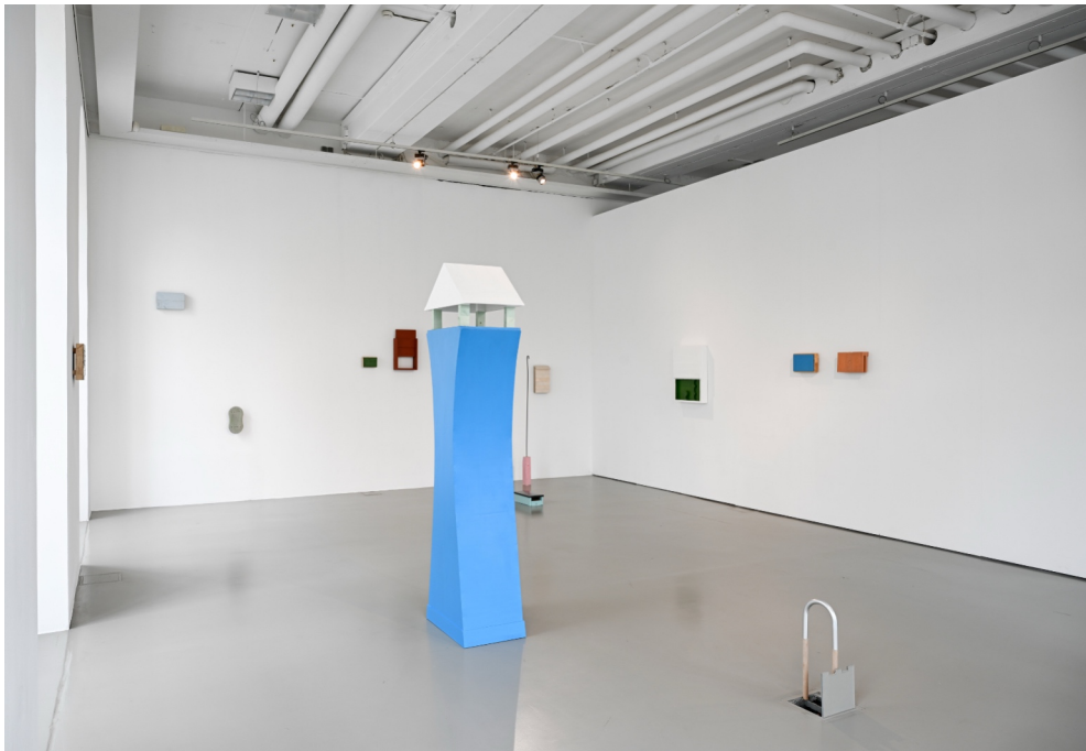
Installationsansicht Kasseler Kunstpreis der Wolfgang Zippel-Stiftung, Kasseler Kunstverein, 2024