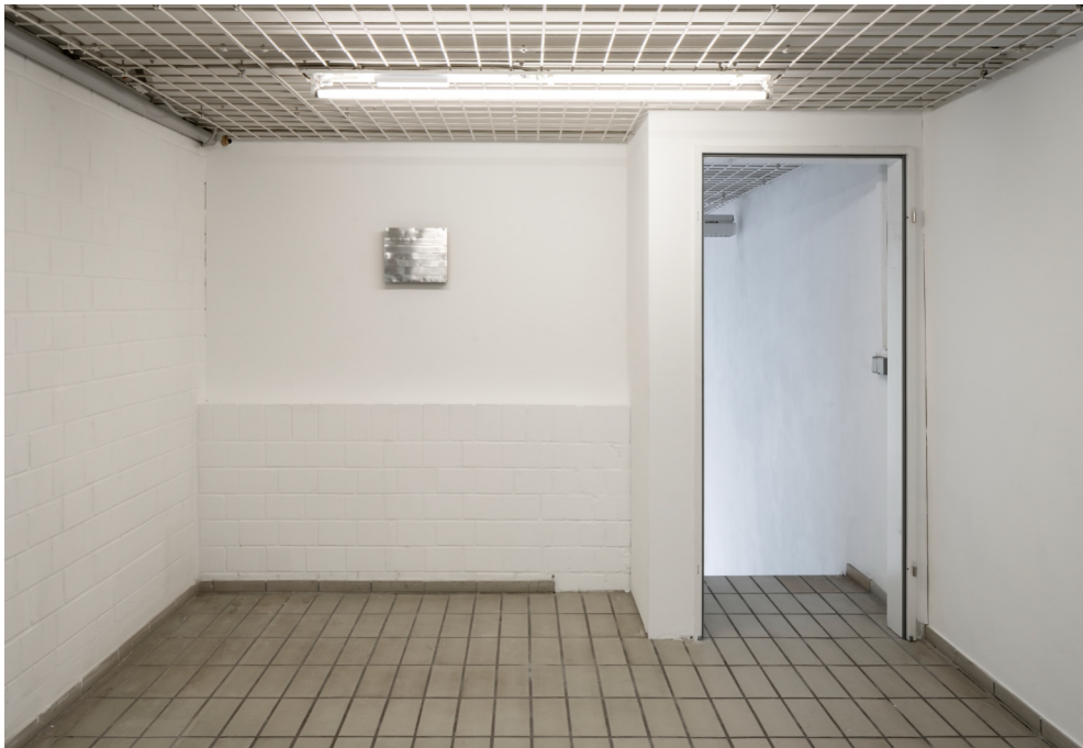
Installationsansicht „Neue Bankverbindung“, 2023